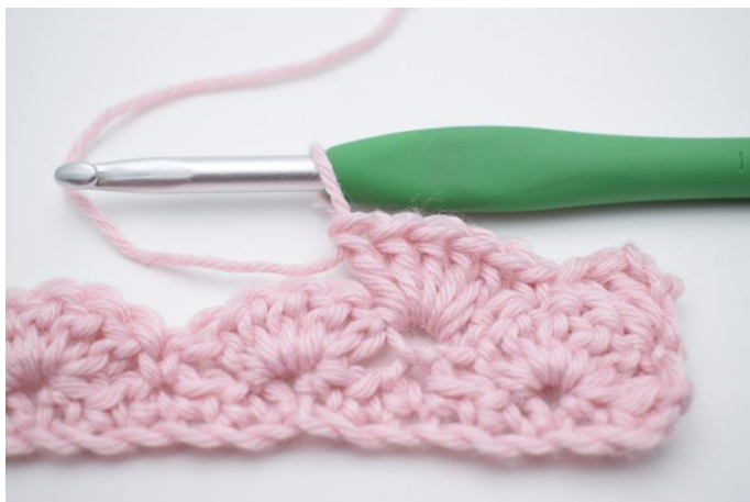
7. Crocheter 5 br dans la m suivante.