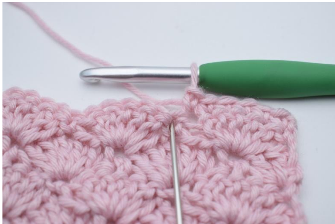
3. Dans la m suivante (marquée par l'aiguille),