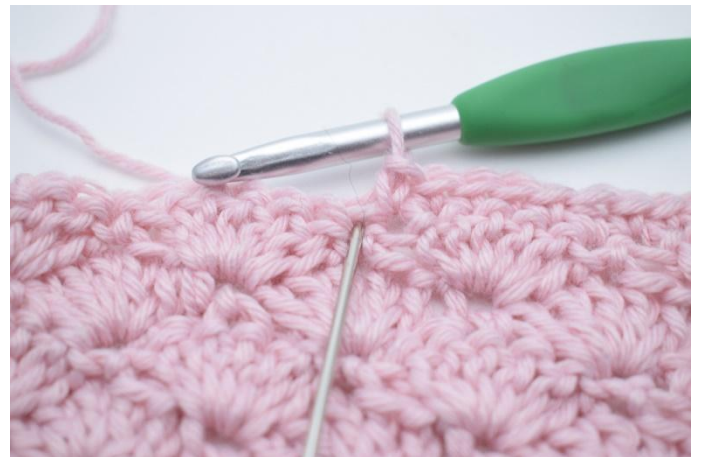
6. Dans la m suivante (marquée par l'aiguille),