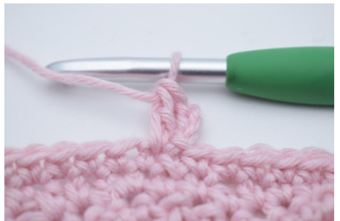
2. Crocheter 1 br dans la même m.