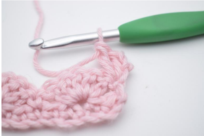
3. Crocheter 2 br.