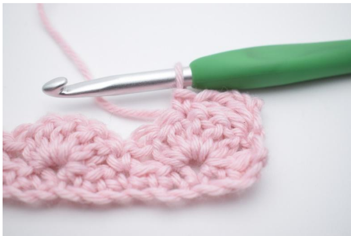
5. Crocheter 1 ms dans la m suivante.