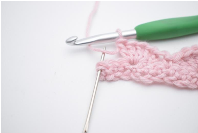
13. Dans la dernière m (marquée par l'aiguille),