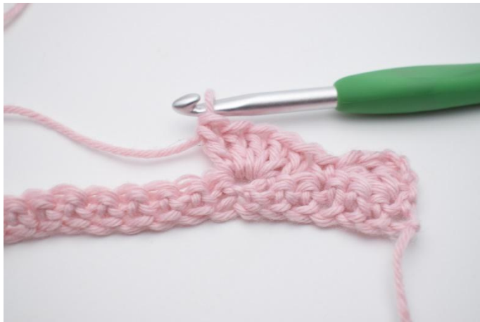
7. Crocheter 5 br dans la m suivante.