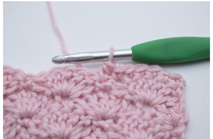
4. Crocheter 1 demi-br.