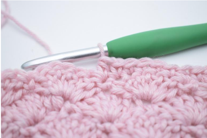
7. Crocheter 1 demi-br.