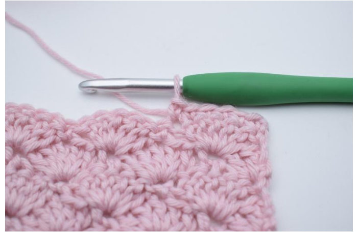
2. Crocheter 1 ms dans les 5 m suivantes.