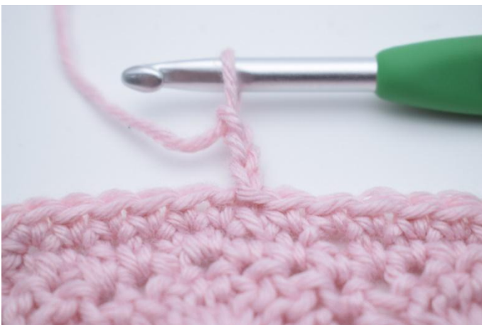
1. 3 ml (compte pour 1 br).