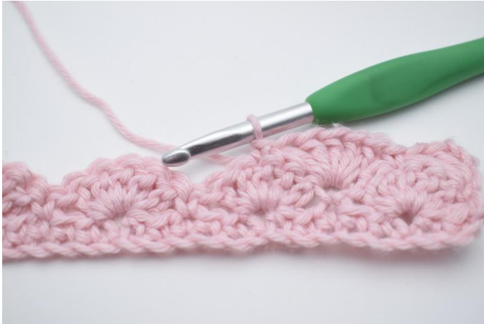
9. Crocheter 1 ms dans la m suivante.