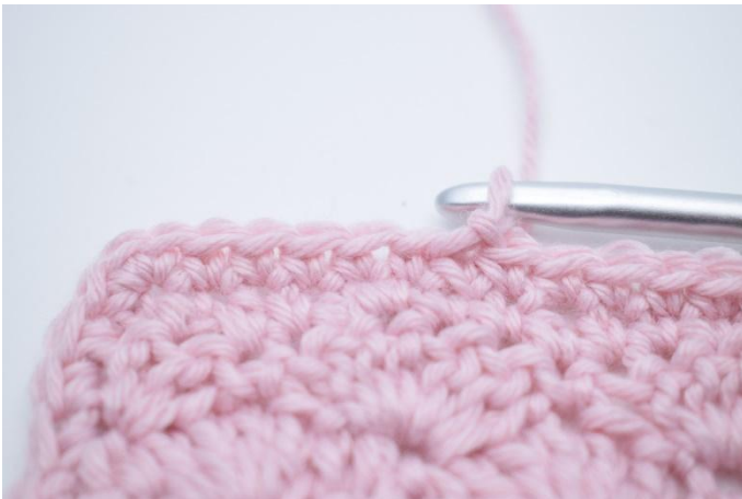
1. Crocheter 1 rang de ms et finir par 1 mc dans la 1ère m.