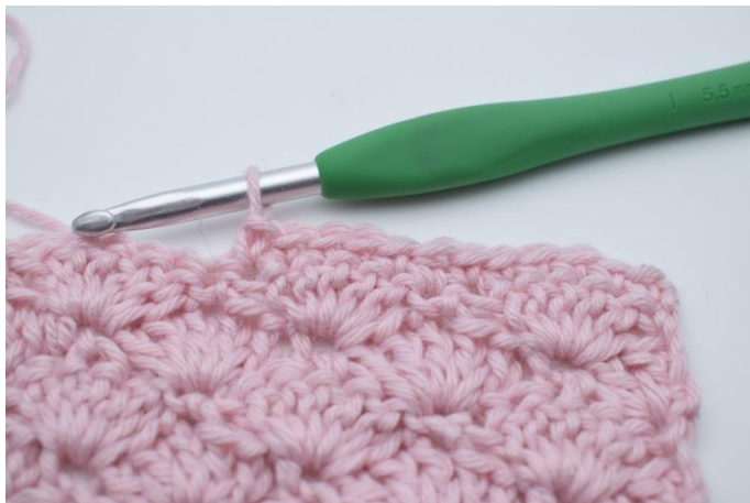
5. Crocheter 1 ms dans les 5 m suivantes.