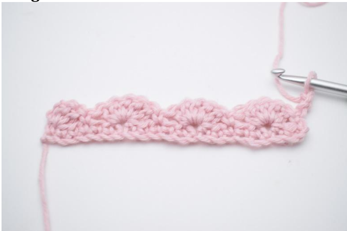
1. Tourner le travail et faire 3 ml.