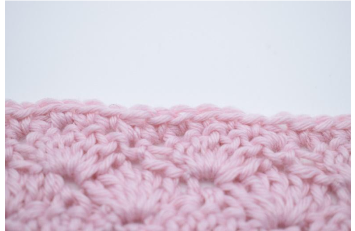
8. Répéter jusqu'à la fin. Couper le fil et le cacher.