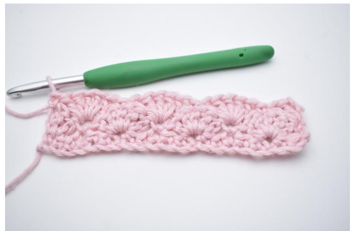
14. Crocheter 1 ms.

Répéter les rangs 3 et 4 comme décrit dans le tutorial.