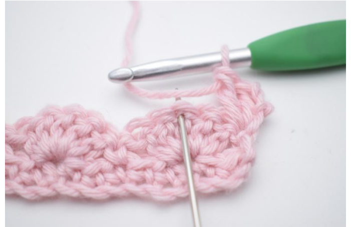
4. Sauter 2 m,