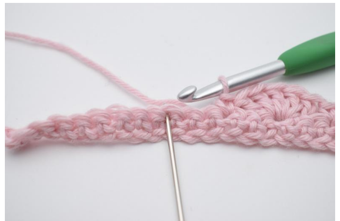
10. Sauter 2 m