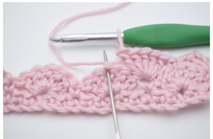
8. Sauter 2 m