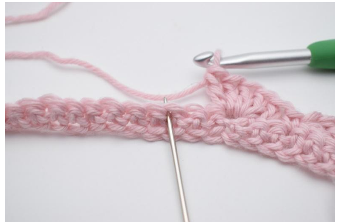
8. Sauter 2 m.