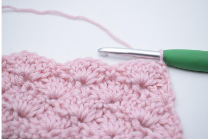
1. Tourner et faire 1 ml.