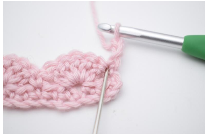
2. Dans la 1ère m (marquée par l'aiguille),