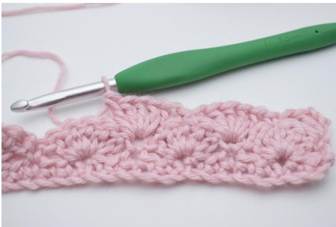
11. Crocheter 5 br dans la m suivante.