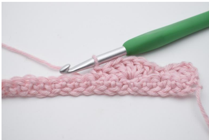
9. Crocheter 1 ms dans la m suivante.