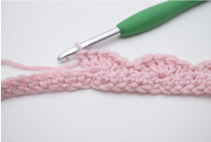
11. Crocheter 5 br dans la m suivante.