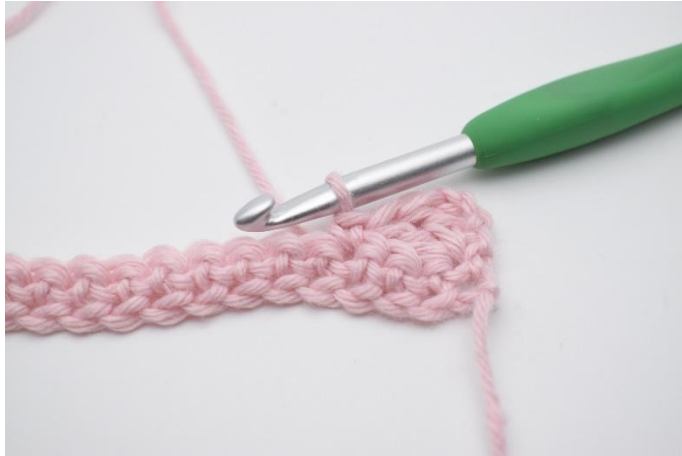
5. Crocheter 1 ms dans la m suivante.