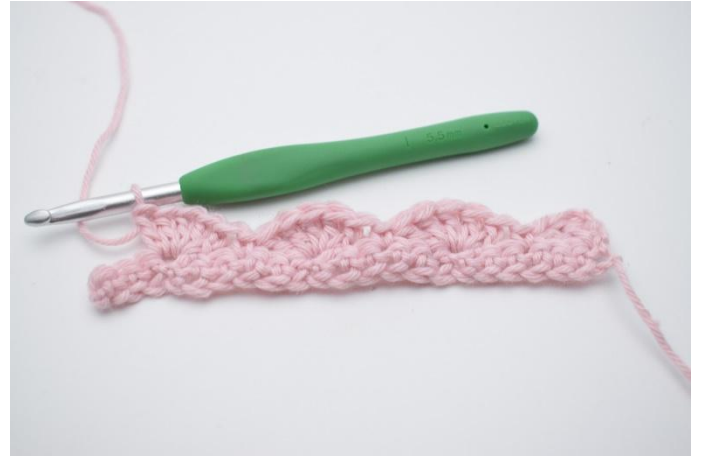
12. Répéter cela jusqu'au 3 dernières m.