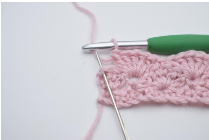
13. Dans la dernière m (marquée par l'aiguille),