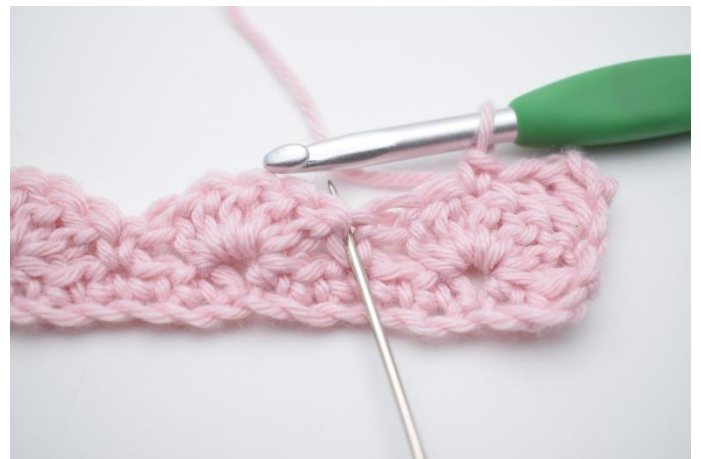
6. Sauter 2 m