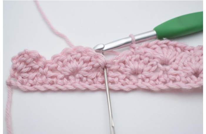
10. Sauter 2 m