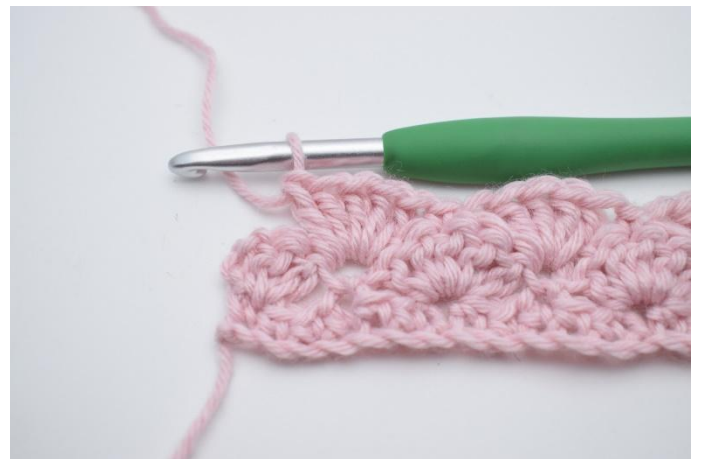
12. Répéter jusqu'à ce qu'il reste 3 m.