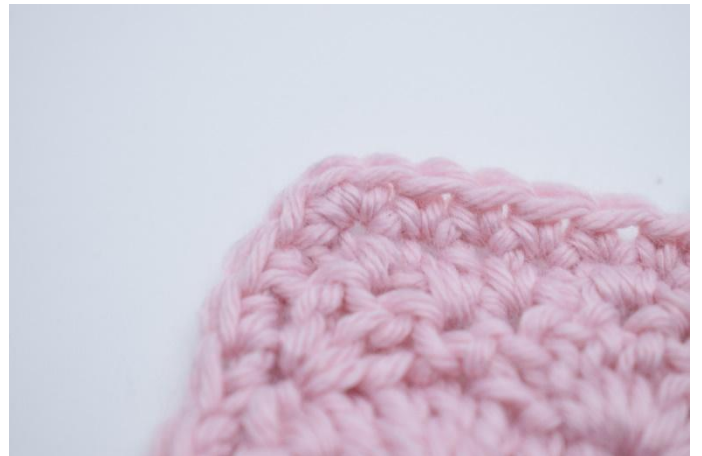
2. Dans chaque coin crocheter 3 ms.