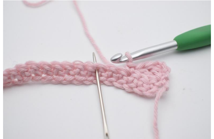
6. Sauter 2 m.