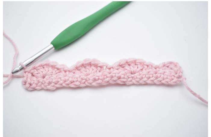
14. Crocheter 1 ms.